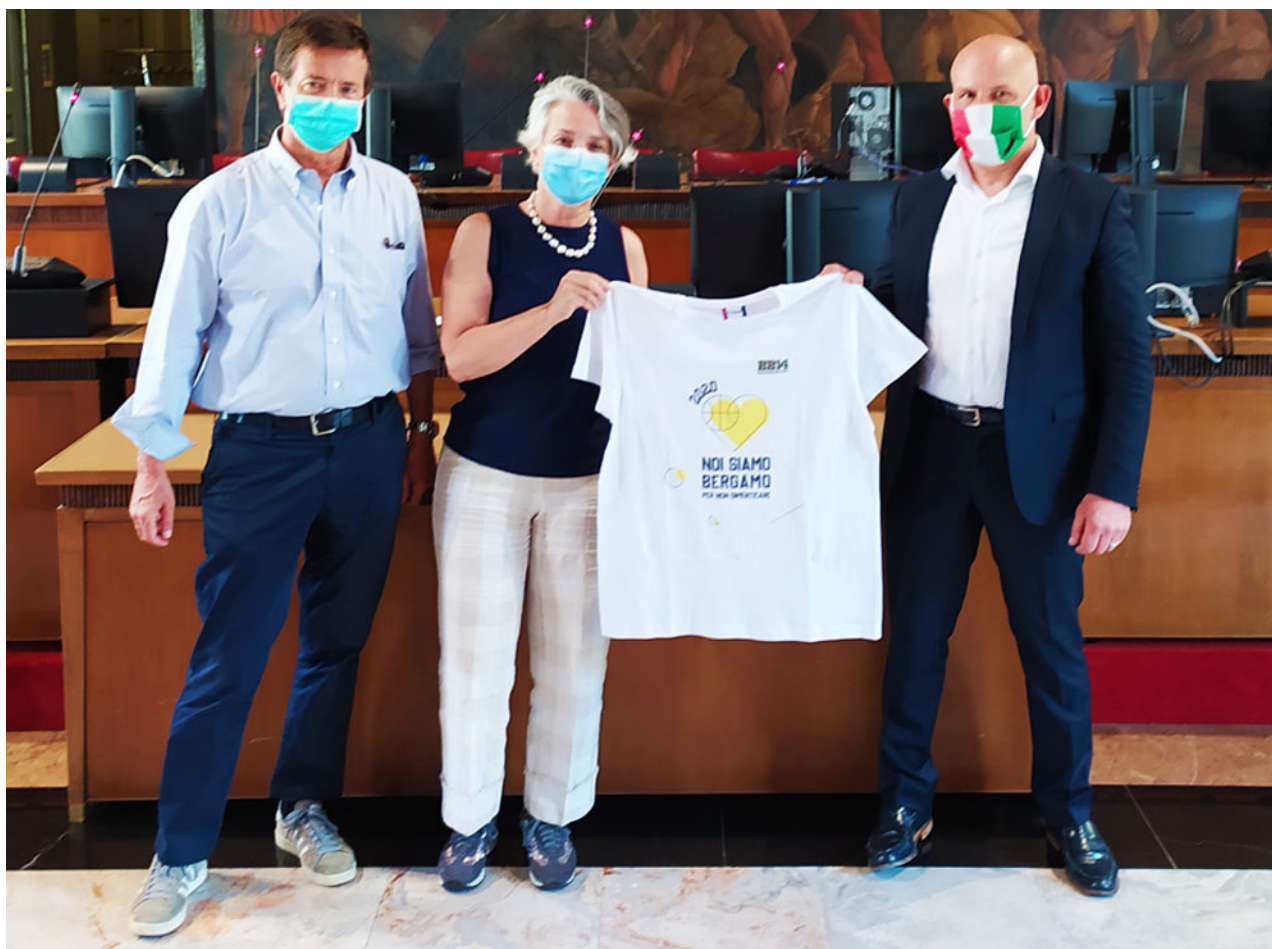
la maglia commemorativa di BB14