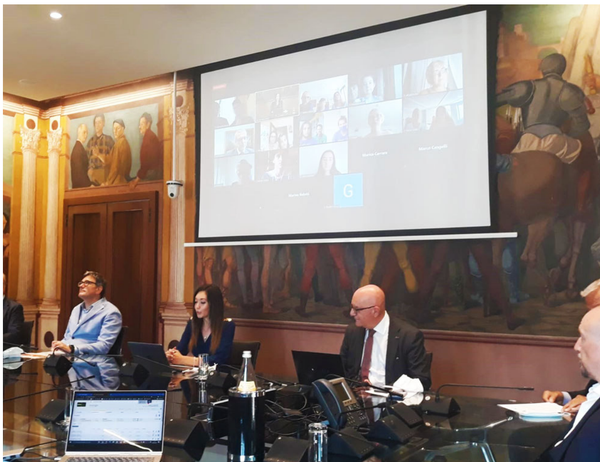
La Sala Gerusalemme Liberata di UBI durante la videoconferenza