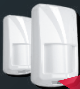
1 rilevatore radio bidirezionale

28 zone radio bidirezionale 4 aree comunicazione IP Alimentazione interna