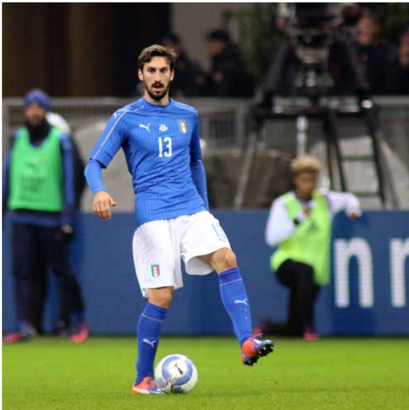
Davide Astori con la maglia della Nazionale.