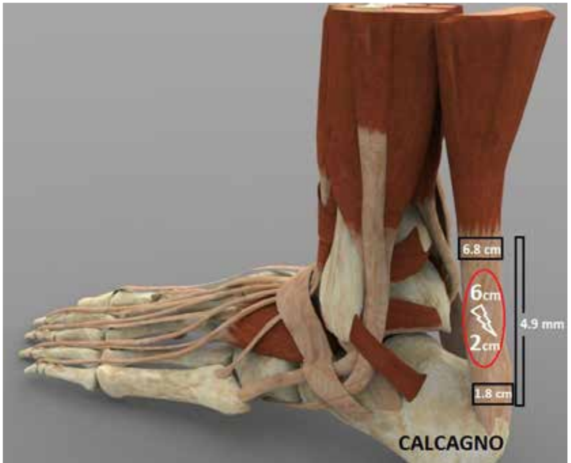
SX (fig.1): Anatomia del tricipite della sura e del tendine di Achille. L'aponeurosi dei gemelli è una membrana che contiene i relativi muscoli.