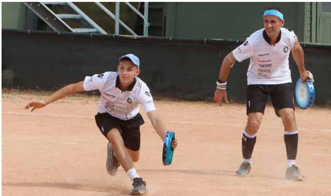
Immagini di recenti partite disputate da Tamburello Arcene.