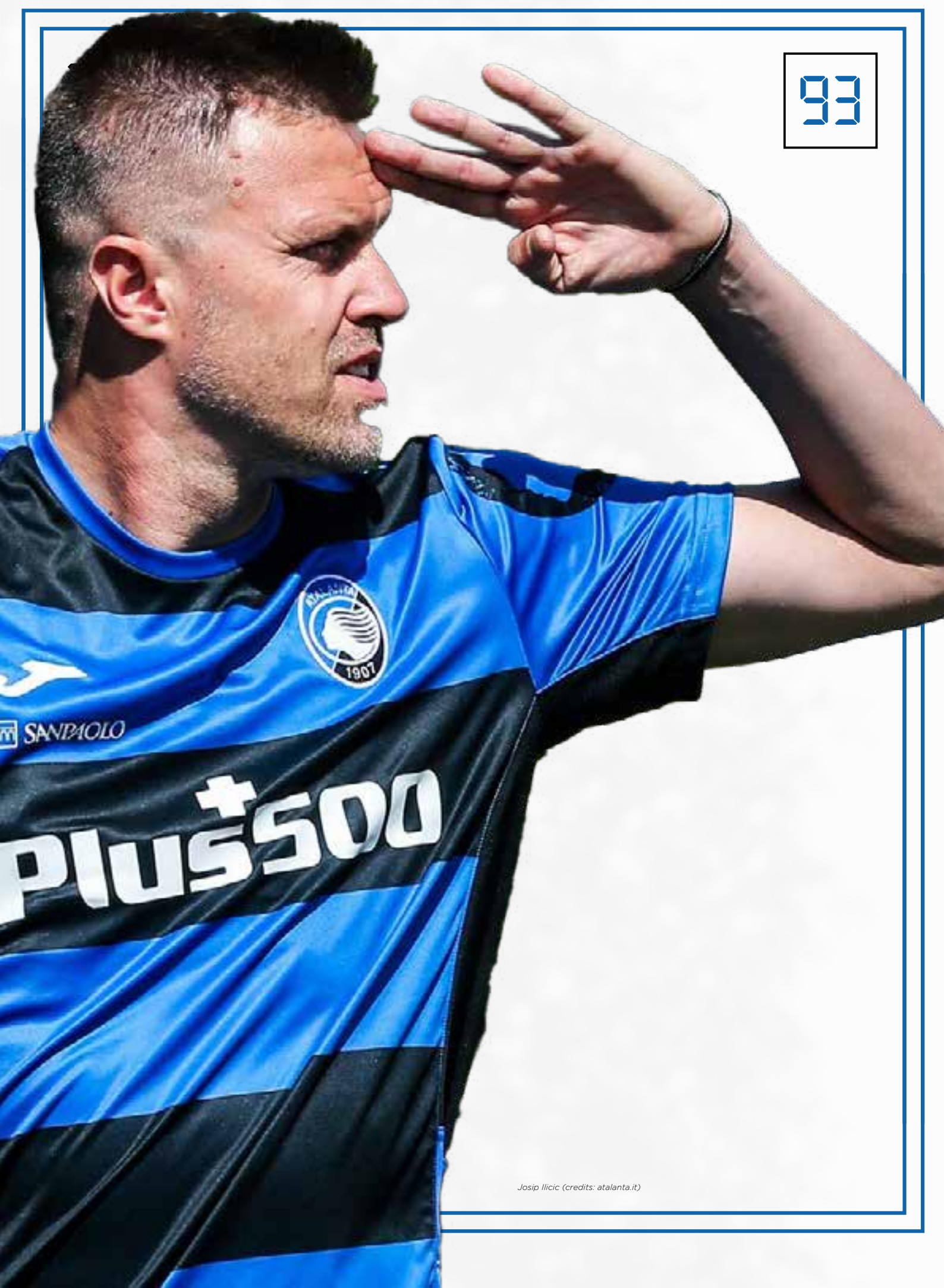
Josip Ilicic